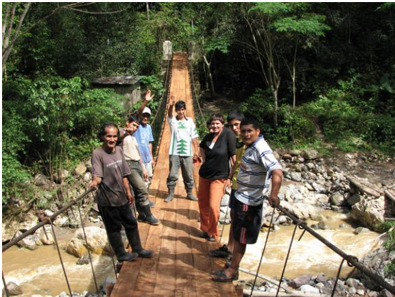
Foto del Puente Terminada