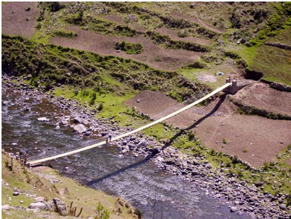
Foto del Puente Terminada

ONG : Puentes para la Prosperidad, Ayuda en Acción