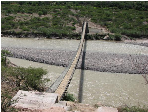
Foto del Puente Terminada

Gobierno : Municipalidad de La Merced Población Beneficiaria: 3000 Comunidad : Chaypara ONG : Puentes para la Prosperidad