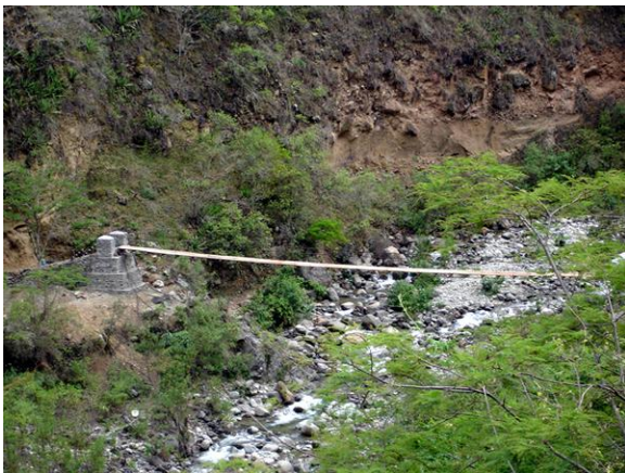
Foto del Puente Terminada